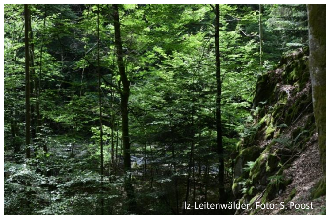
Ilz-Leitenwälder, Foto: S. Poost